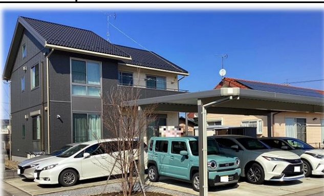
南西側より撮影現地外観 【掲載写真: 2024年3月撮影 ※街並み含む】